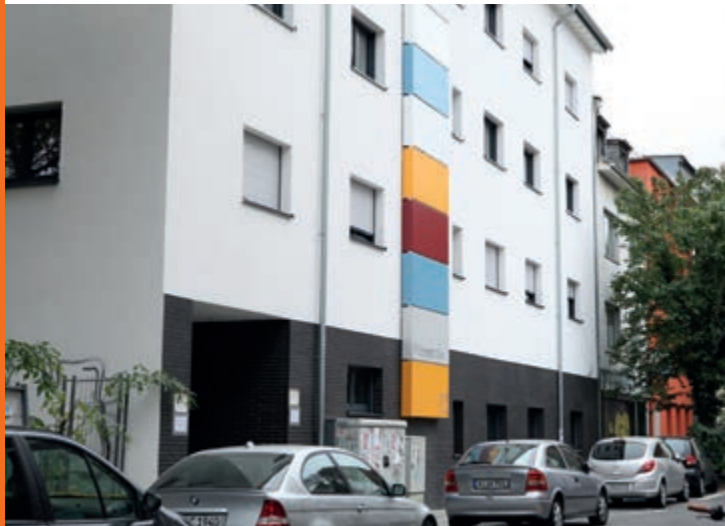
Blick in die Philippsstraße

Entsprechend dem gemeindenahem Ansatz, ist das Machabäerhaus mitten im beliebten Stadtteil Köln-Ehrenfeld angesiedelt. Es besteht eine sehr gute Anbindung an die Innenstadt.